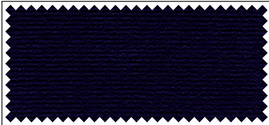
nachtblau / bleu nuit / night blue