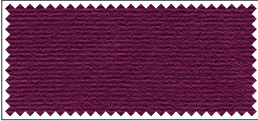
weinrot / bordeaux / wine red