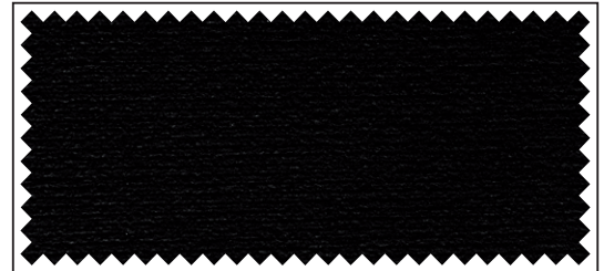
tiefschwarz / noir foncé / jet black