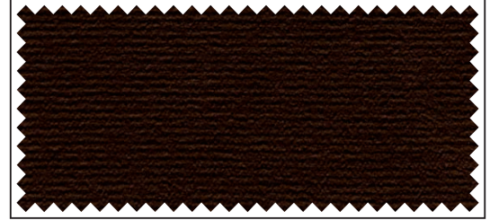
braun / brun / brown