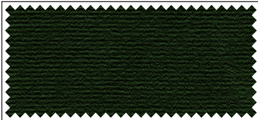
grün / vert / green