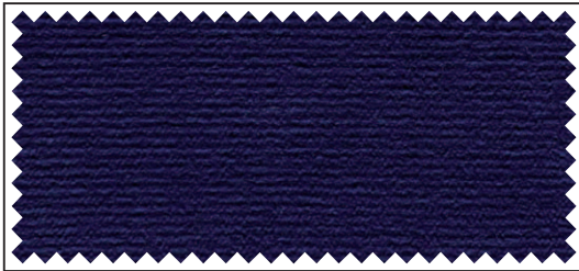
blau / bleu / blue