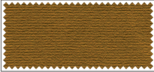
gold / or / gold