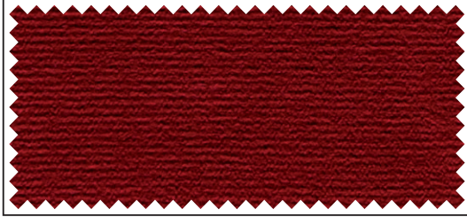
rot / rouge / red