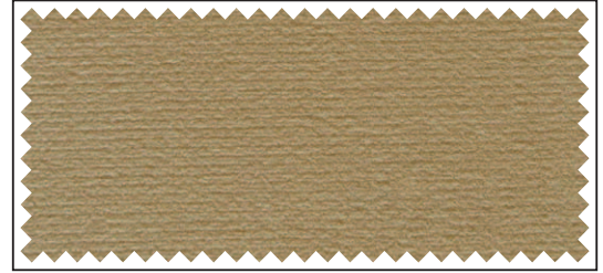
beige / beige / beige