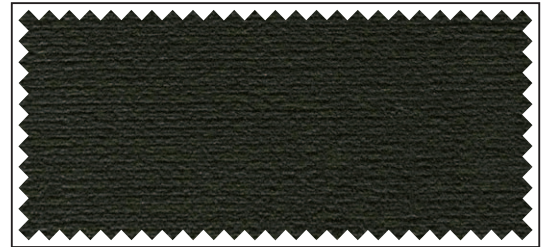
dunkelgrau / gris foncé / dark grey