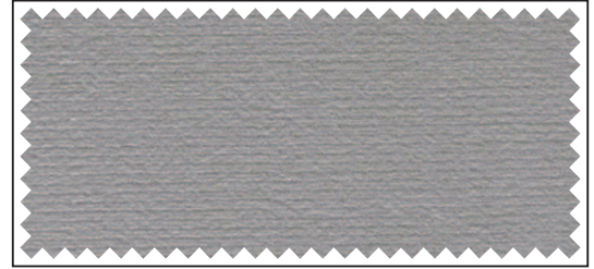
hellgrau / gris clair / light grey