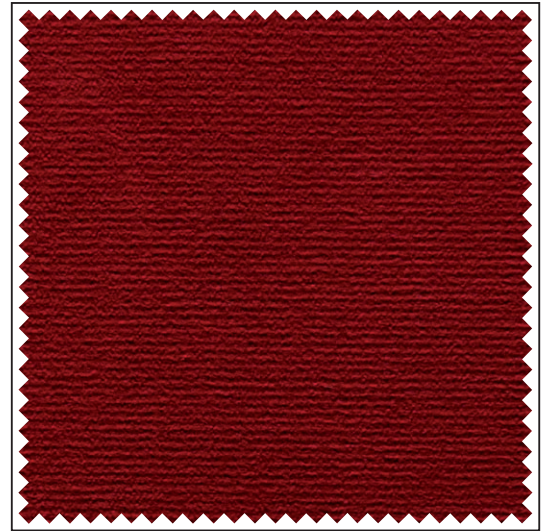
Griffmuster / Echantillon / Sample

Erläuterungen der Brandschutz- normen B1, M1, BS, EN, EN* und NFPA unter www.gerriets.com .